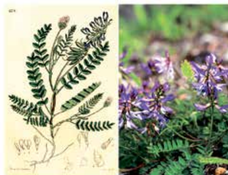
Tunturijohanneksella (Larix laricina) pirtinää ja laumonsa.